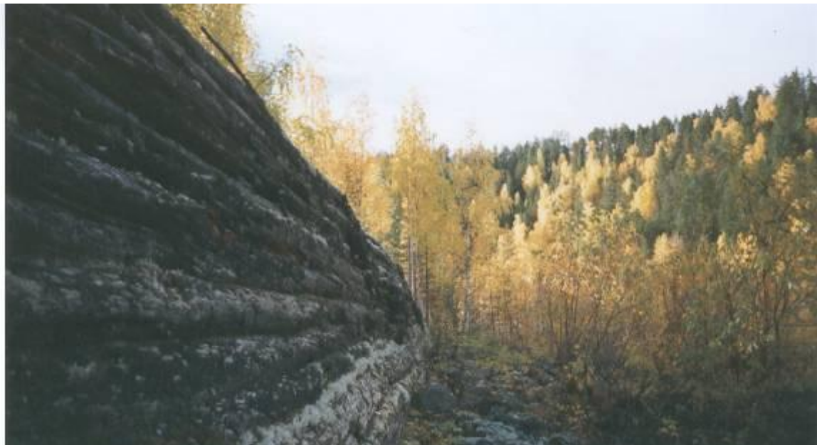
Del av stenkistan på Granholmen

Efter besöket på Laxholmen och Granholmen bilade vi till rastplatsen ovanför bron för rast och fika. Eftersom vädret inte var det bästa, så redovisades i stugan kartor, skisser och foton över området och berättades om historiska händelser, bl.a. Edeforskravallerna.