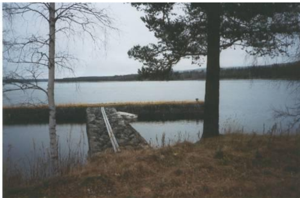
Piren i Överedet

Så avslutades vandringen 2007 med ett välkommen till byavandringen 2008, som äger rum i Storsand.