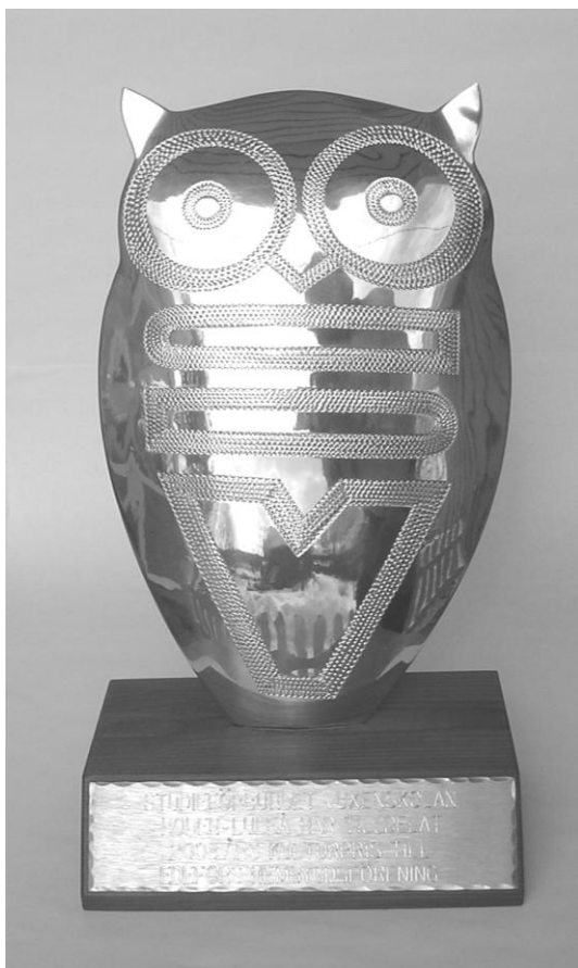
Text på sockeln:STUDIEFÖRBUNDET VUXENSKOLAN BODEN-LULEÅ HAR TILLDELAT 2008 ÅRS KULTURPRIS TILL EDEFORS HEMBYGDSFÖRENING