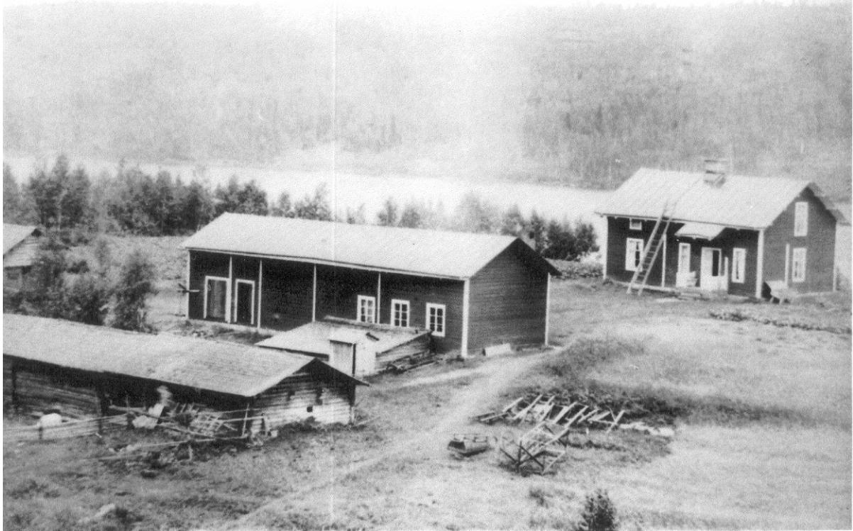
Kronojägarbostället i Åbacka 1910

I Åbacka hade man nära till Luleälven, som var den tidens stora pulsåder för såväl sommar- som vintertrafiken. Och troligen hade de en egen ångbåtsbrygga att tillgå.