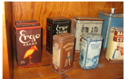
Ovanstående bilder är från "Gamla lanthandeln" i Kläppgården