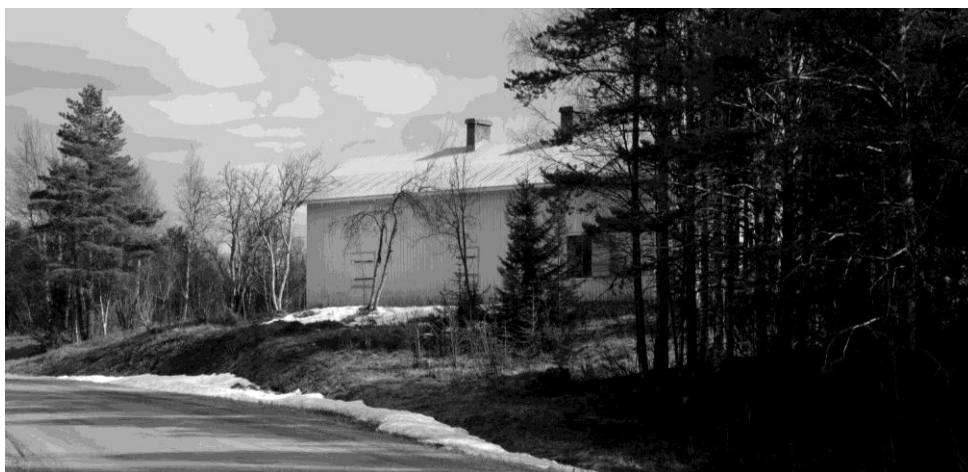
Bild 6. Lakaträskgården anno 2005.