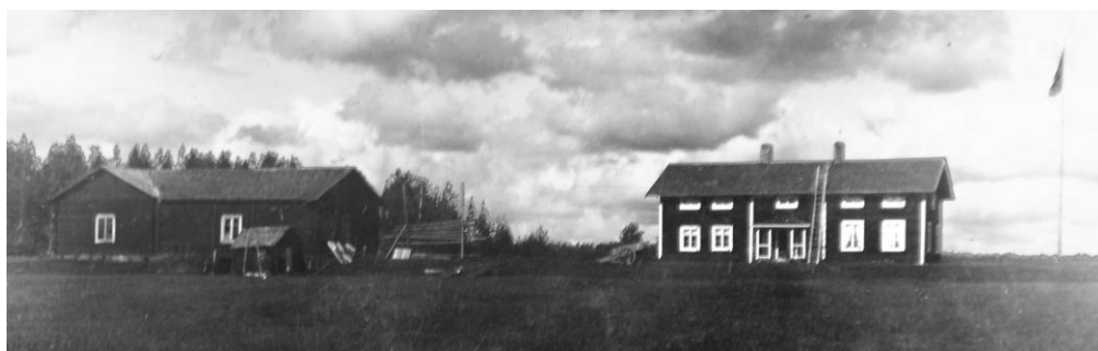
Bild 4. Lakaträskgården anno 1920.