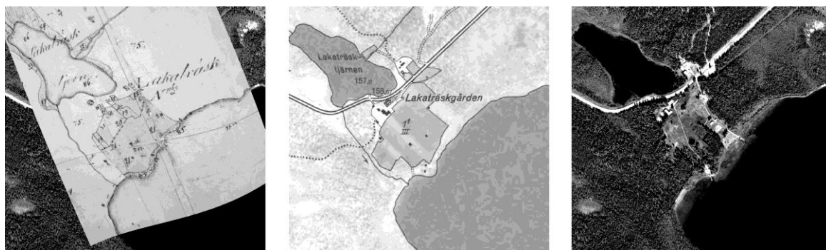
Bild 1. De centrala delarna av Lakaträsk nybygge som det såg ut år 1844, år 1950 respektive år 2010. Ängs- och åkermarkens utbredning är i princip oförändrad från år 1844 till idag.

Att ansöka om att få inrätta ett kronohemman innebar att man ansökte om laglig rätt att mot beskattning få bruka kronans mark. Om ansökan gick igenom erhöll nybyggaren ett antal års skattefrihet för att underlätta inrättandet av ett fungerande jordbruk och hushåll. Efter skattefrihetens tid, synade staten hemmanet för att undersöka lämpligheten att driva det vidare och för att fastställa dess beskattningsbarhet. I bild 1 nedan visas nybyggets centrala del, som det såg ut vid statens syn år 1844, år 1950 respektive år 2010.