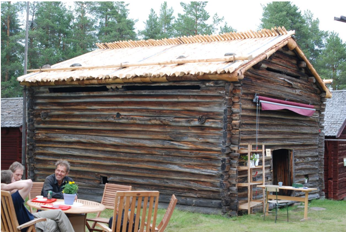
Paus och en trevlig pratstund med intresserade besökare. Rökbodans nävertak färdigt.

En överraskning när vi rev taket på rökbodan var, att här var det inte bara näver och takved, utan det bestod uppifrån räknat av: takved, näver, platonmatta, papptak och näver, vilket medförde oerhörda mängder byggskräp att kärra ut för vidare transport. Vi fick även göra nytt vågbord på väggen som vetter mot matbodan. Vågbord är en kluven stock som ligger utanför hammarbandet och har till uppgift att vara upplag för nävret. Nävret läggs bara löst, med i detta fall cirka trelagstäckning, och takveden av rund barkad senvuxen granslana läggs löst med låsning över nock, som sedan stenas fast med stenar närmare takfoten för att motstå väder och vind. Viktigt med taknäver är att det exponeras så lite som möjligt, vilket gör det oerhört långlivat. Nävret levererades av Koler trä med ursprung från Ryssland. Lars-Göran Hedberg, Vuollerim, deltog i detta arbete liksom allt framöver. Han har också tagit fotona i artikeln.