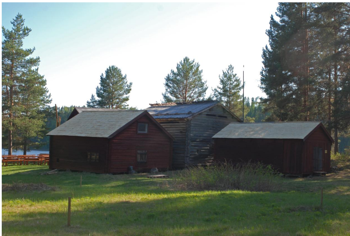
Rökbodan, matbodan och isbodan med nya tak.

Vill avsluta med att tacka alla så väldigt mycket och säger som Mats Karström: ”Laxholmen – en längtans plats”