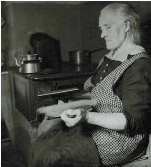
Kardningen sker vid den varma ugnen.