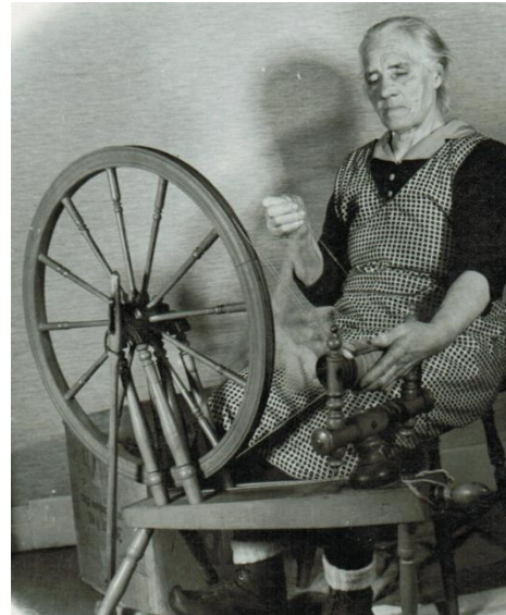
Sist kommer spinnrocken fram.