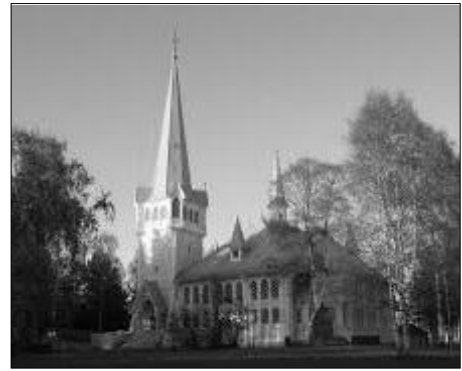
Jokkmokks nya kyrka, invigd 1889

Dessutom tillkom rådhusen i Kalmar och Söderhamn efter hans ritningar. Ja, listan över alla hans arbeten hade kunnat göras längre.