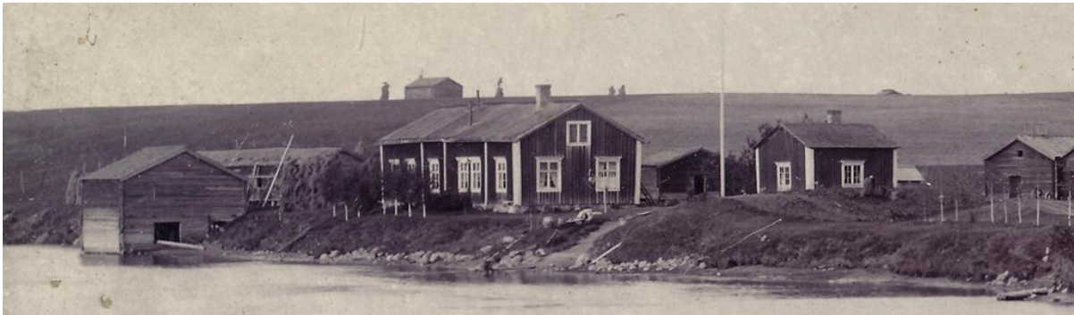
Gården ca 1905-1910